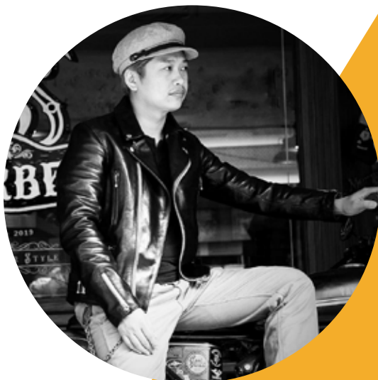
最 chill 宗師 J'S Barber shop 王家駒

2020春夏話題，顏值擔當瀟灑捲髮漸層次，理推剪與捲度層次的多變化性，讓你回到沙龍現場商業提率大翻倍！